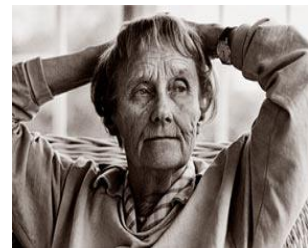
1 ; Astrid Lindgren

Giv mit barn læsehunger det beder jeg om med brændende hjerte for jeg vil så gerne at mit barn skal få i sin hånd nøglen til eventyrlandet hvor de dejligste af alle glæder findes” 1